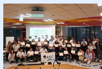
Training in Sweden in September