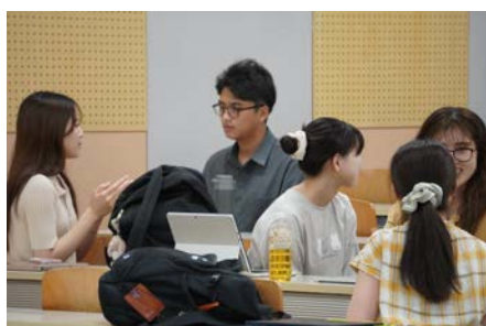
【総合科目】アントレプレナーシップ入門