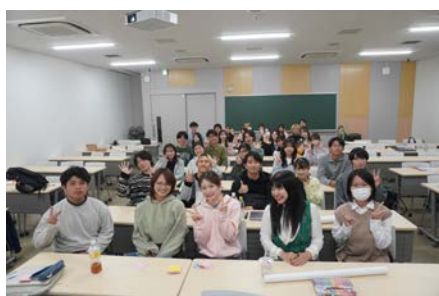
【総合科目】アントレプレナーシップ・キャリアデザイン